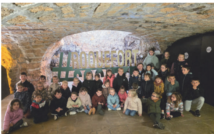
Les élèves ravis de leur visite des caves !

À présent, les enfants ont le regard tourné vers Noël : les petites mains s'activent pour fabriquer cartes et décorations.