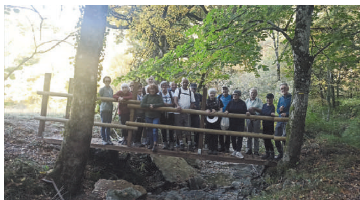
Photo : près de St-Félix-de-l'Héras