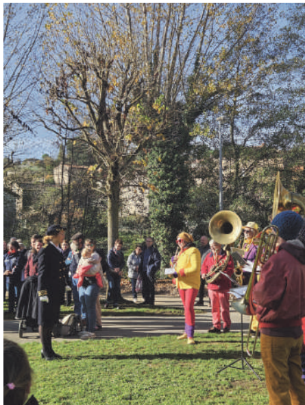
Un beau 11 novembre. Cette célébration restera dans le souvenir des Saint-Georgiens.

Le pot de l’amitié, sous les barnums dressés par les employés municipaux dans le jardin, a connu un franc succès.